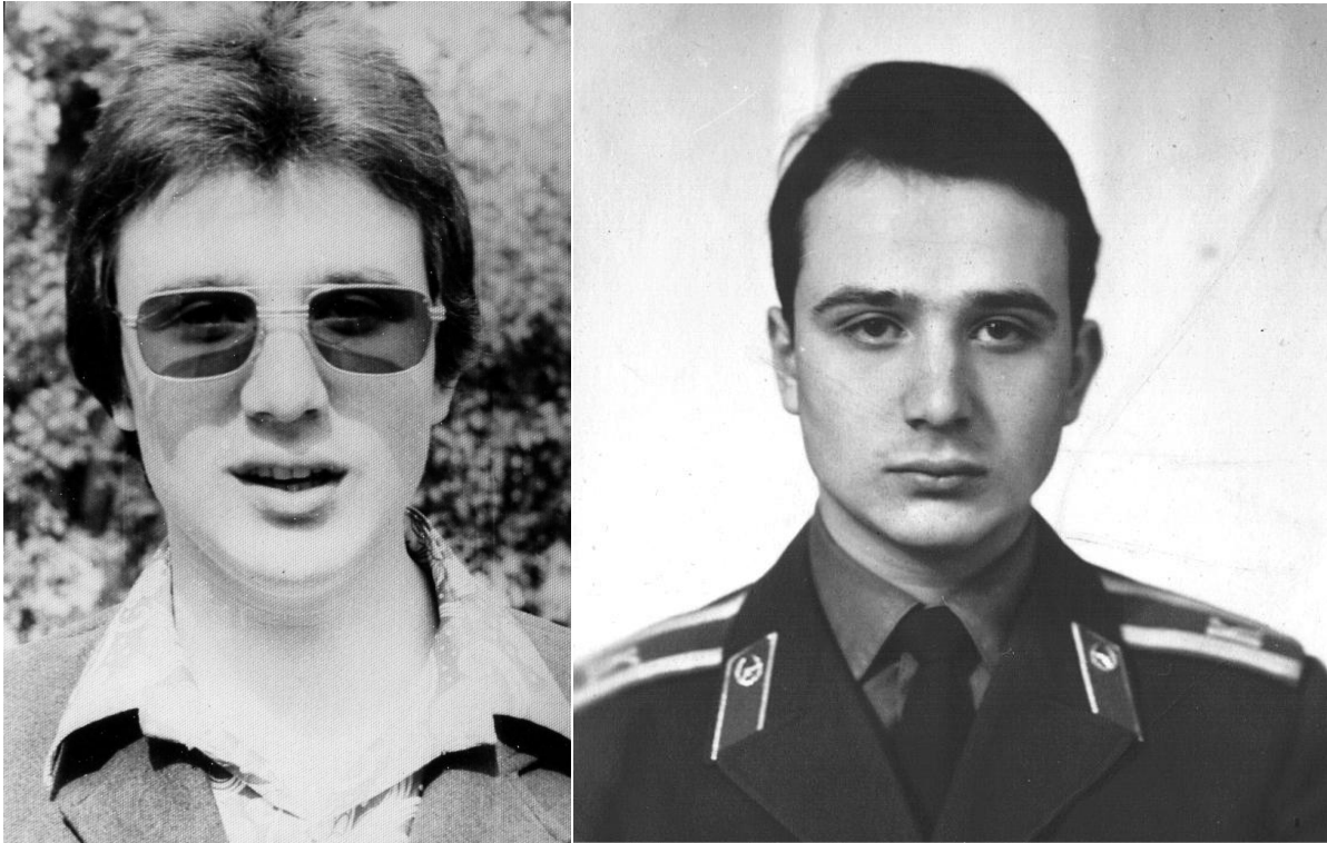
Автор до и после присяги, 1976-й год.