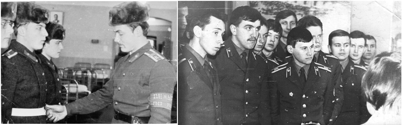
Первый курс Восточного факультета ВИМО, 1976-й год.