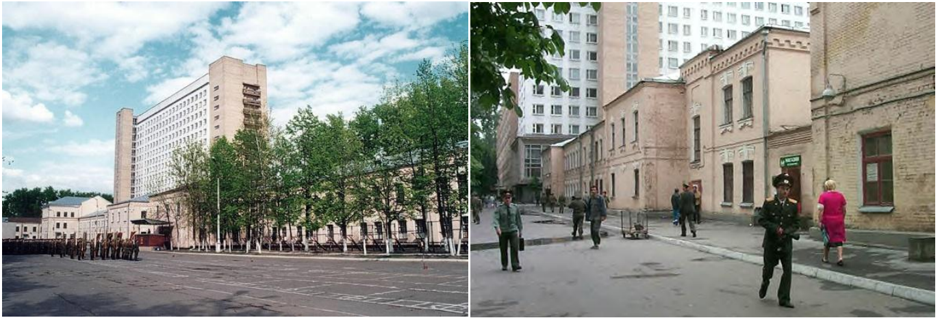
Военный Университет МО РФ, 2000-е годы. По материалам Интернета.