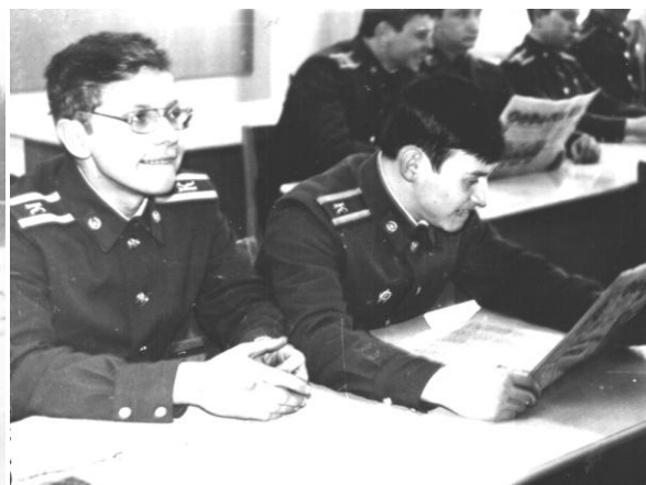
Из жизни «китайской» группы. Первый курс Восточного факультета ВИМО, 1976-й год.

Сдача наряда прошла легко, когда второкурсники Западного факультета сменили нас достаточно быстро. То ли, люди нормальные попались, то ли, мне уже было все равно от усталости, но сдачу своего первого институтского наряда по кухне я помню смутно. О нашем пенном приключении никто не поминал: служебные заботы, учебная нагрузка, усталость брали свое. Серые институтские будни растянулись надолго. За первые четыре года курсантской жизни я побывал в сотне разных нарядов, легких и не очень, встречал новый 1978 год в карауле, торчал целый год на «почетном» первом посту у институтского знамени и даже умудрился устроить тайное свидание со знаменитыми «неприкосаемыми» курсистками в тишине воскресного