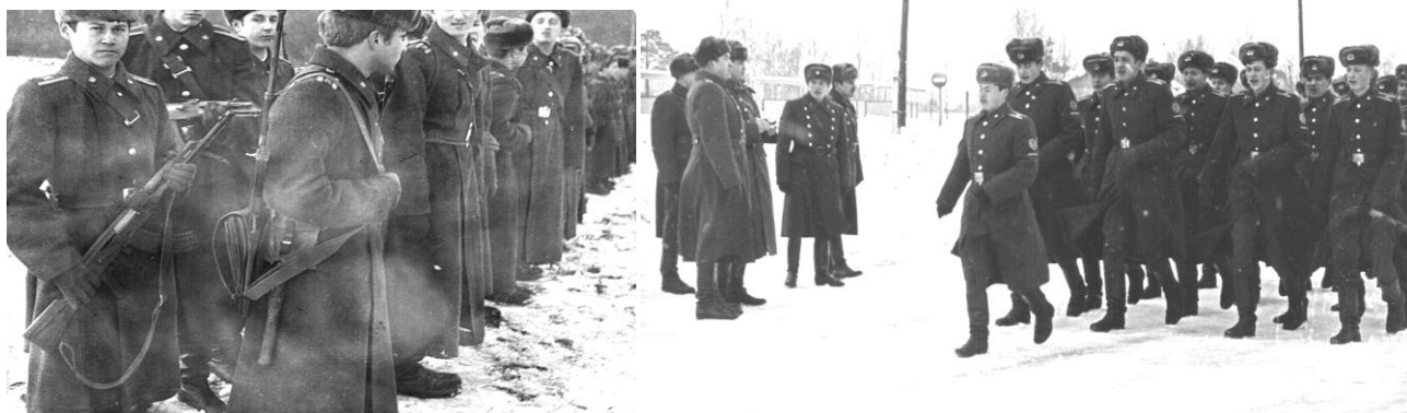
Из жизни «китайской» группы. Первый курс Восточного факультета ВИМО, 1976-й год.

...Сильная струя воды из шланга ударила в густую, крахмальную массу на полу помещения, на что незнакомая желтоватая субстанция ответила белой взбитой пеной. Через пять минут интенсивного полива стало ясно, что добрая тонна картошки, варварски превращенная хитроумными курсантами в беловатую жижу на полу овощерезки, смываться в решетки канализации не собиралась. Полный напор в шланге сделал