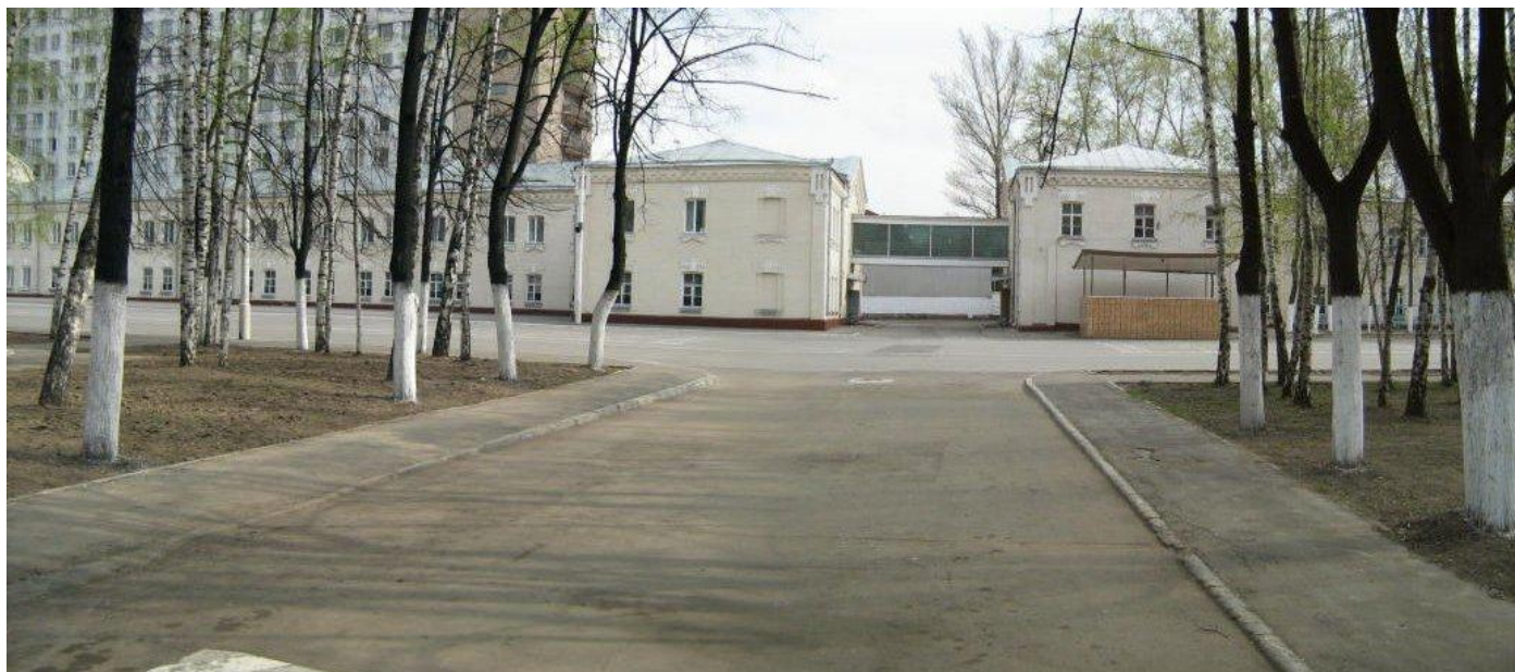
Казарма Восточного факультета ВИМО - место проживания автора в период 1976-1979гг. Фото 2000-х годов, по материалам Интернета.