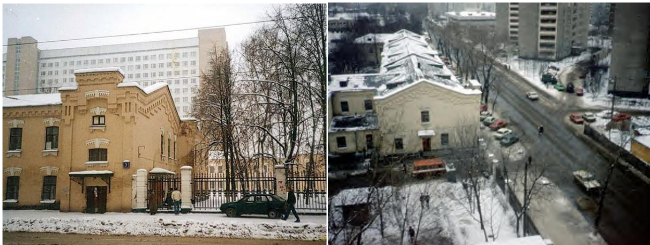
Слева: вид на учебный корпус ВИМО с Волочаевской улицы. Справа: вид на Волочаевскую из курсантского общежития «Хилтон», место проживания автора в 1980-м году. 1980-е годы.