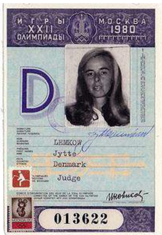
Олимпийское удостоверение судьи, Москва 1980 год.