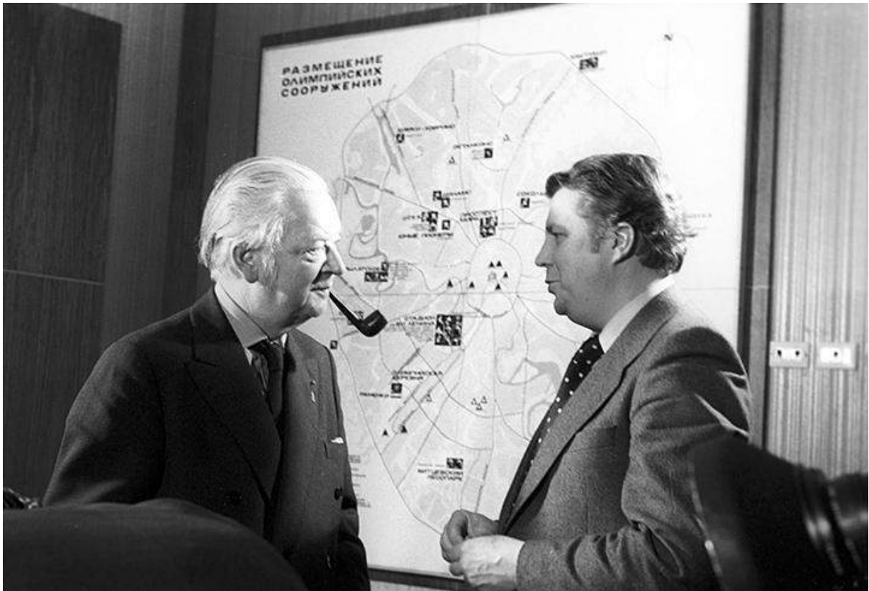
«Прорабы» XXII Олимпийских игр в Москве. 1980 год.