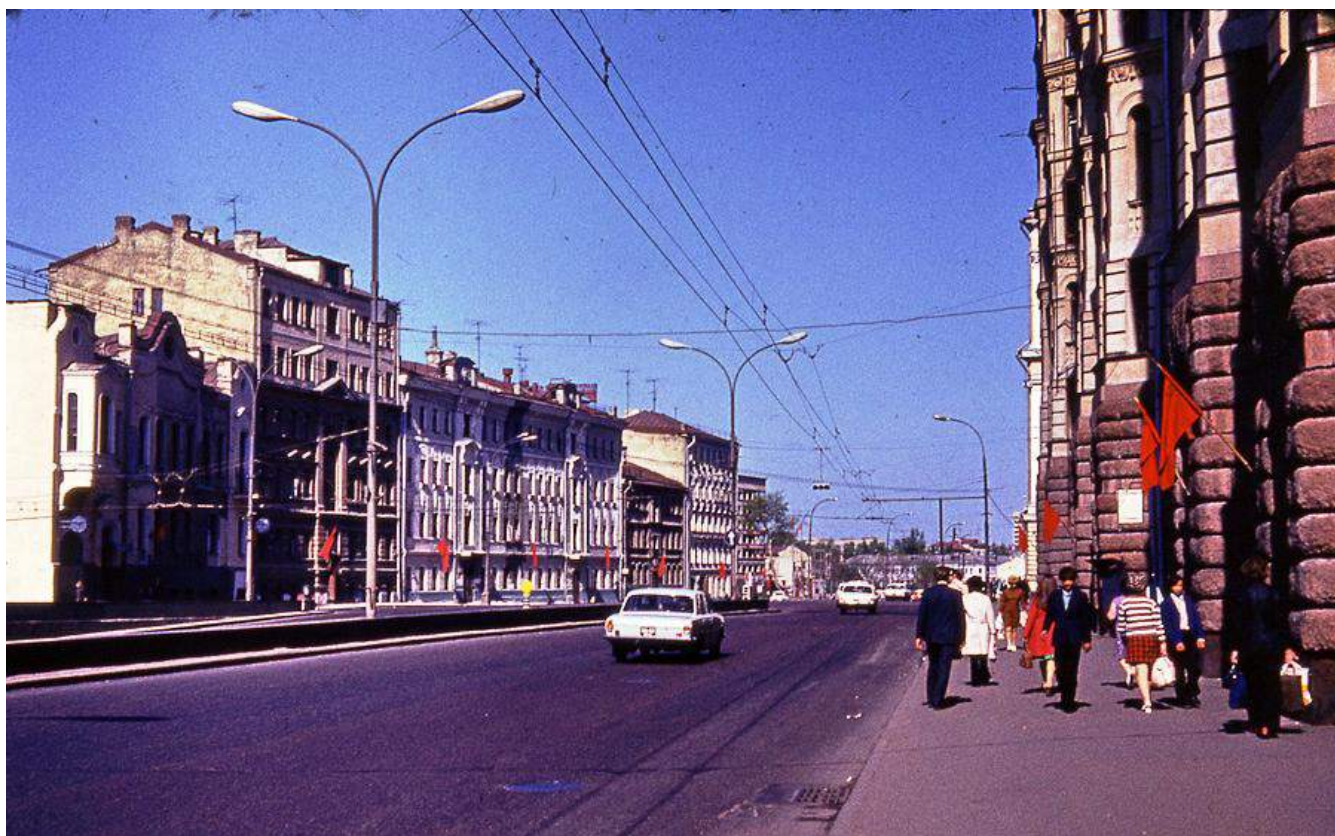
Москва олимпийская, 1980 г.

Иногда историки спорят – какой год считать расцветом СССР? Одни полагают, что Страна советов по энергии катилась к светлому коммунизму аж до 1990-х, до момента своего самороспуска, другие – что концом строительства развитого социализма следует считать приход к власти горячо любимого на западе Горби, однако, некоторые называют другую дату – 1980 год. Последний «до-афганский» год, когда мир еще благополучно развивался в условиях потеплевшей «холодной» войны, когда «проклятые русские» уже были не такие страшные, и когда советская столица Москва встречала самый светлый праздник международного спорта – летние Олимпийские игры. Если, с чем-то и можно поспорить, но значение XXII Олимпийских игр для Советского Союза, и особенно для Москвы, вряд ли кто будет оспаривать.