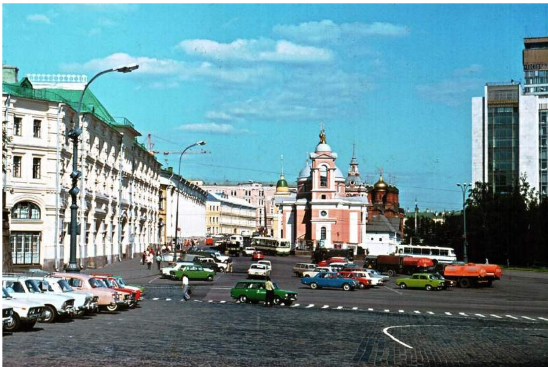
Москва олимпийская, 1980 год.

Шереметьево-2 было не только самой «западной», но и, вероятно, самой дорогой стройкой олимпийской Москвы. Масштабное расхищение строительных материалов особенно заметно на импортных стройках, что приводило к колоссальным затратам, когда европейские фирмы-подрядчики восполняли похищенное добро. По рассказам моего друга проблемы Ш-2 после его сдачи не закончились: в течении первых нескольких дней в аэропорту было расхищено практически все, что плохо лежало. «Лежало» имеется ввиду не только свободно установленные огнетушители или уборочный инвентарь, а даже немецкая арматура, краны и прочая в общественных туалетах. Качественная немецкая туалетная бумага «уходила» из туалета вместе с прикрученным к стене блестящим немецким держателем, а однажды сотрудники «Шарика» обнаружили вместо красивых европейских раковин в местном ватерклозете только дырки в стене при этом трубы водоснабжения были аккуратно снабжены заглушками. Милиция и сотрудники специального, «олимпийского», 11-го отдела КГБ были направлены на предотвращение краж в Ш-2, но полностью остановить народное движение удалось лишь после Олимпиады, когда аэропорт официально «рассекретили».