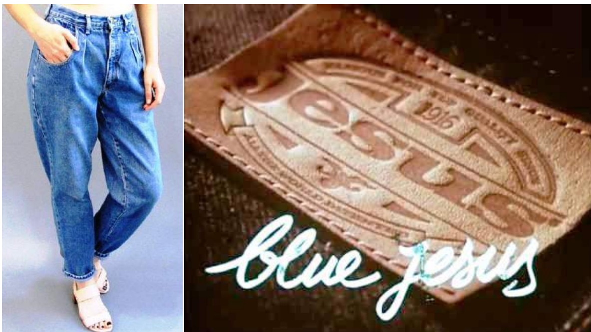
Продвинутая фирма Jesus и ее продукция.

Прошло немного времени и однообразный цвет военнослужащих на территории Военного Института был дерзко разбавлен ярко и модно одетыми курсантами-«олимпийцами», которые по указке «особого» отдела стали вживаться в роль «гражданских специалистов». Настоящую аскомину зависти вызывали эти улыбающиеся счастливицы, когда мы узнали, что их больше не заставляют стричься с целью не выделяться из московской толпы. Следует отметить, что в 1980 году длинные волосы у молодежи были очень популярны. Вероятно, олимпийское задание было действительно важным, если, даже институтскому дураку-подполковнику, начальнику группы, досталось от КГБ, когда он «постриг» по собственной инициативе необузданных курсантов. Институтские «олимпийцы» досрочно сдали сессию и продолжали заниматься по своей программе, но их задвинули подальше, с глаз долой, дабы не разлагать остальную часть курсантов. Ежедневные построения группы перенесли в сквер перед институтским общежитием «Хилтон», место более закрытое и близкое от КПП. Неожиданно внешний вид наших «олимпийцев» изменился в сторону единообразия, что для меня навсегда осталось в памяти вершиной неистребимой армейской тупости.