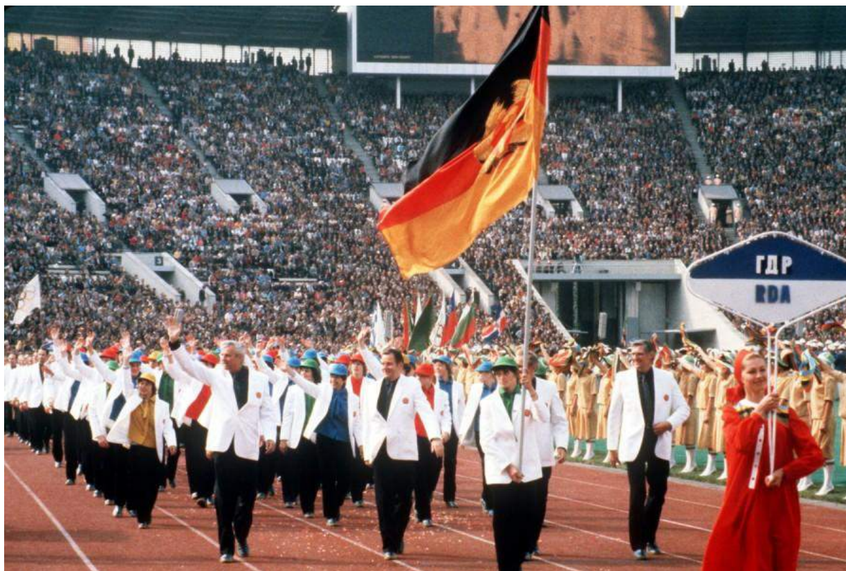
Команда ГДР, Москва 1980 год.

Не буду пересказывать известную статистику, напомним лишь, что не приехали в Москву представители 64 стран (из около 200, входящих на тот момент в ООН). Нет, были спортсмены и из «капиталистического лагеря», но все они приехали на Олимпиаду-80 по собственной инициативе и выступали под олимпийским флагом, а не своей страны. Это, к примеру, Италия, Франция, Великобритания, Австралия, Дания, Швейцария, Испания, Бельгия, Нидерланды, Ирландия. Это только те, кто выигрывал медали, которые пошли в неофициальный зачёт командного первенства. Когда ещё скромная Куба в медальном зачете займёт высокое 4-е место? А Болгария — третье? Больше никогда. Но, для нас, московских обывателей, олимпиада запомнилась известными постановлениями московского правительства по принципу – «меньше народу – больше кислороду!»