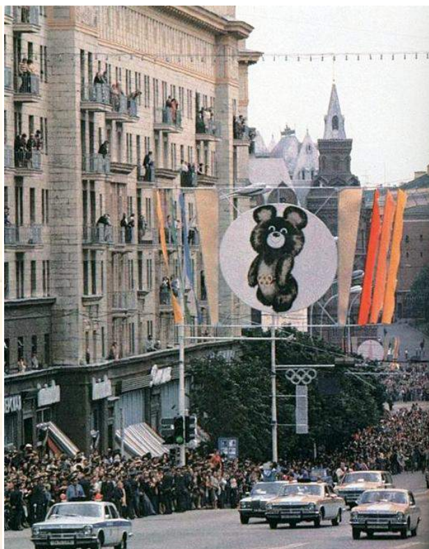
Схема московского метро и Олимпийский огонь на улице Горького, 1980 год.