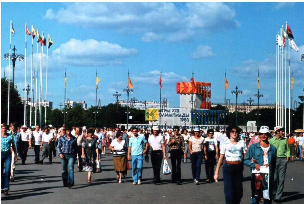
Москва-олимпийская, 1980-й год.