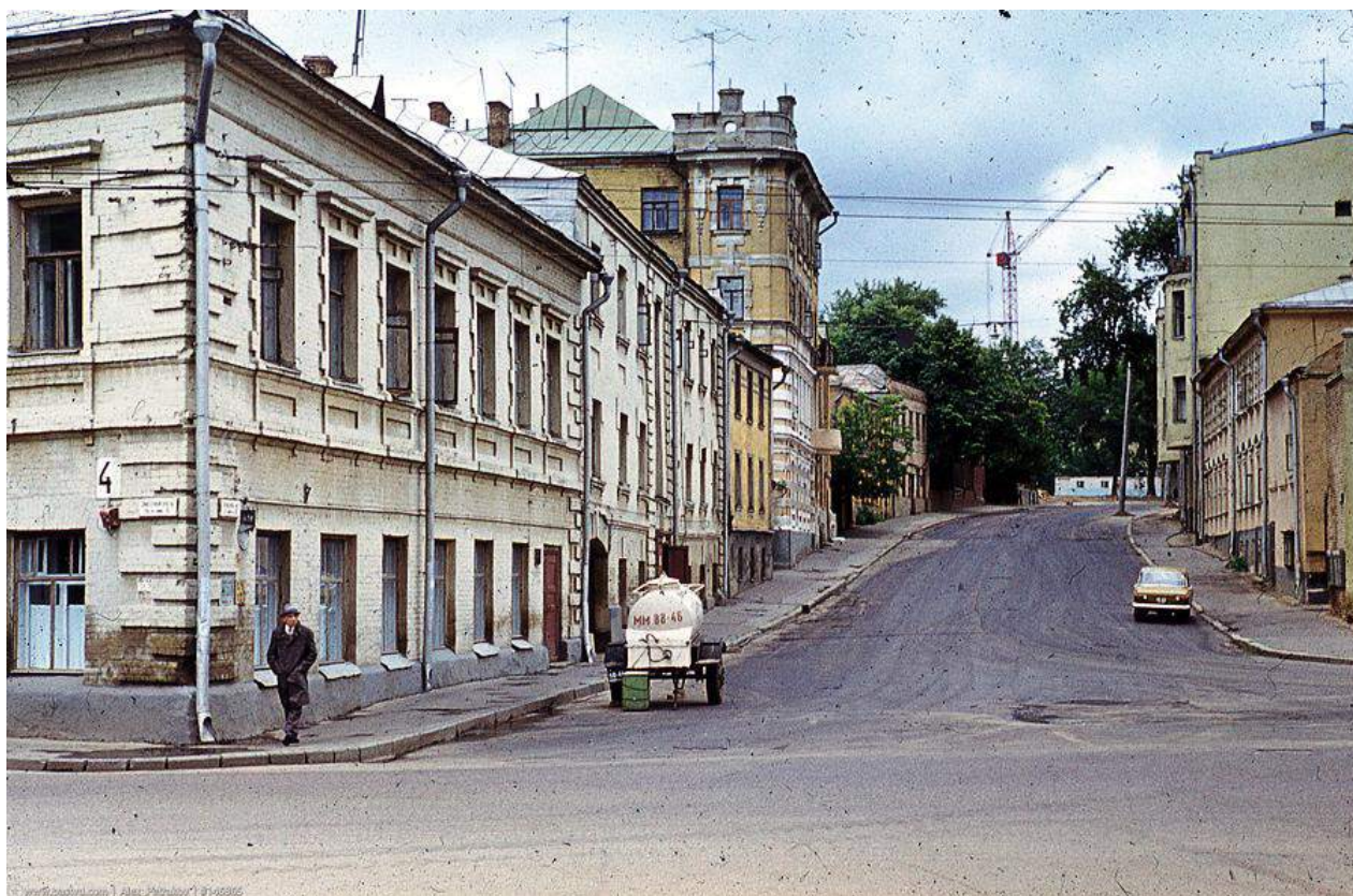
Москва-олимпийская, 1980 год.

Как известно, самая коррумпированная международная организация — Олимпийский Комитет не устояла перед подношениями и широким русским гостепреимством за государственный счет. Советская Россия была признана способной принять летнюю Олимпиаду 1980-го года. Советским представителям удалось установить, как было принято писать в документах тех лет, доверительные отношения с избранным в