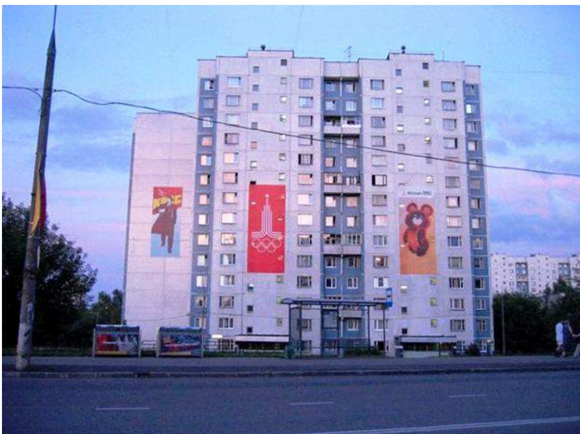
Москва-олимпийская, 1980 год.

Как всегда, бремя олимпийских расходов было переложено на плечи трудящихся. Для покрытия расходов на строительство советское правительство приняло решение выпустить лотерею «Спринт», позволяющую хотя бы отчасти выправить ситуацию. Но и здесь все получилось не так, как планировалось «Доходы,- докладывал в ЦК оргкомитет в 1978 году,- могли быть и больше, если бы Госиздат Украинской ССР обеспечил в установленные сроки реконструкцию предприятия „Заря“ и выпуск в 1976-1977 годах 400 млн билетов этой лотереи. Фактически за этот период было изготовлено и реализовано всего 230 млн билетов». В связи с олимпийской стройкой века были своего рода и моральные потери: существует мнение, что, кроме колоссальных невосполнимых расходов на Олимпиаду-80, Москва потеряла ряд исторических зданий-памятников зодчества, снесенных во имя новых храмов спорта.