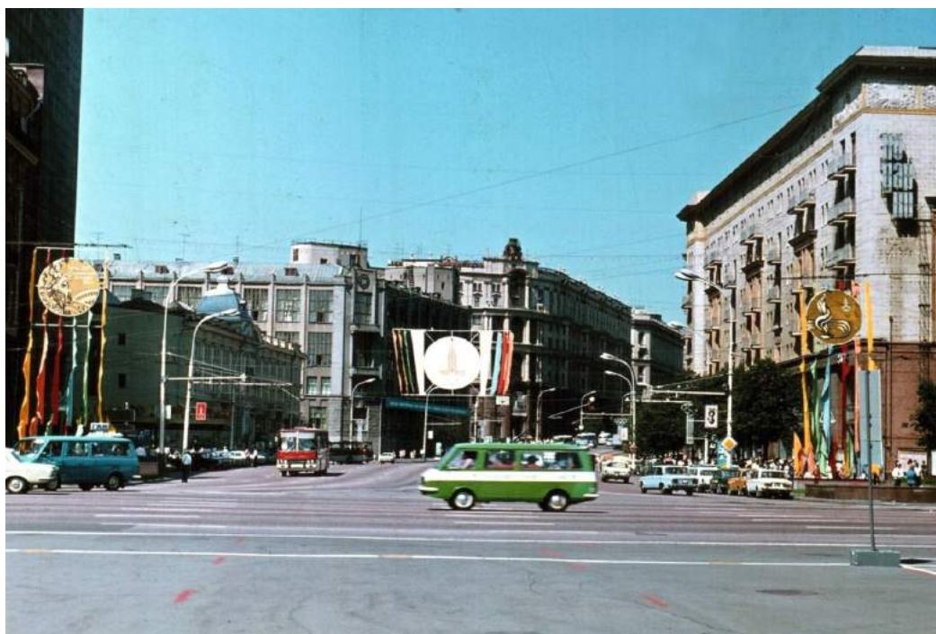
Москва-олимпийская, 1980-й год.