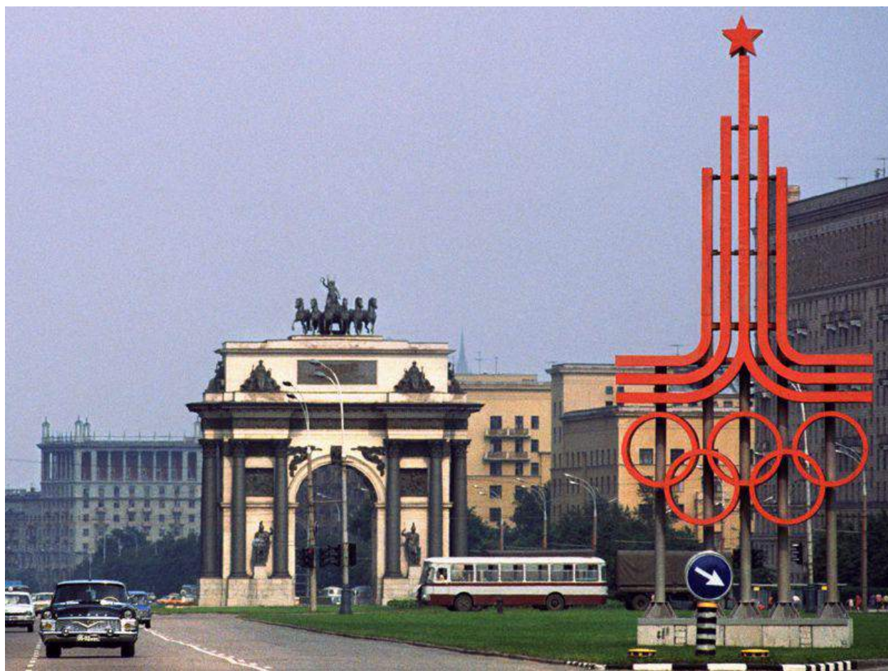
Москва-олимпийская, 1980 год.

Специально для летней Олимпиады должно было быть построено 78 объектов. Программа развития города была принята еще в 1971 г. с перспективой получения права на проведение Олимпиады, и в 1974 г. Международный олимпийский комитет выбрал Москву в качестве города для XXII Олимпийских игр. Было решено создать шесть основных олимпийских спортцентров: на севере — общегородской спортивный центр в районе Проспекта Мира; на западе — общегородской спортивный центр в Крылатском; на северо-западе — спортивный центр в районе Ленинградского проспекта; на востоке — спортивный центр Измайлово; на юге — конноспортивную базу в районе Битцевского лесопарка; на юго-западе — Лужники и Олимпийскую деревню. Трудно было бы предположить, что колоссальные объемы строительства пойдут без запинки. Извечная русская безалаберность, расточительство и, просто, нерасчетливость, поставили под сомнение грандиозные планы сдать олимпийские объекты в срок. Однако, в средствах на престижные объекты правительство СССР не скупилось: Олимпиада заработает миллионы!