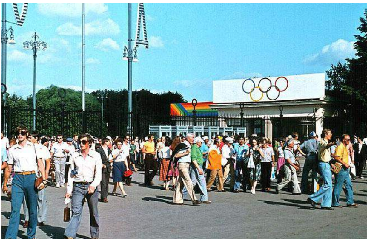
Москва-олимпийская, 1980-й год.

головотяпов тыловики готовы были поверить все, но то, что полученные джинсы пришли по адресу, можно было расценивать, как провокацию империализма.