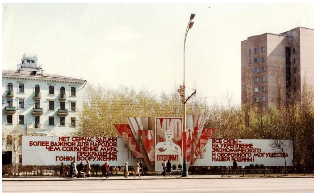
Москва-олимпийская, 1980 год.

Колоссальная по масштабу подготовка к московской Олимпиаде ставила кадровые вопросы. Как мы теперь хорошо знаем, светлый праздник свободного спорта обслуживается по традиции «волонтирами», местными гражданами-добровольцами, которые с удовольствием и бесплатно трудятся на всех олимпиадах мира. Гиды, переводчики, работники пунктов питания и обслуживающие спортивные состязания составляют многотысячный костяк работников спортивного мероприятия. Понятно, что в советской столице образца 1980 года свободный доступ на спортивные объекты, наполненные капиталистическими гражданами, был невозможен. Не могу судить о других профессиях, но с переводчиками на московских играх дело было туго. Все возможные ресурсы советского Интуриста и т.п. были задействованы, но требовалось гораздо больше специалистов языков разных и редких. СССР в массе был традиционно «безязыковой» страной, где даже международным английским языком владели только специалисты. Как водится, на помощь пришло Министерство Обороны СССР, обязавшись поставить в строй сотни переводчиков для работы на Олимпийских играх. Причем, участок работы был выделен весьма ответственный и непростой – встреча и отправка иностранных гостей в новом аэропорту Шереметьево-2. Неудивительно, что для этого были выделены языковые специалисты проверенные в идеологическом и профессиональном плане: курсанты Военного Института МО СССР.