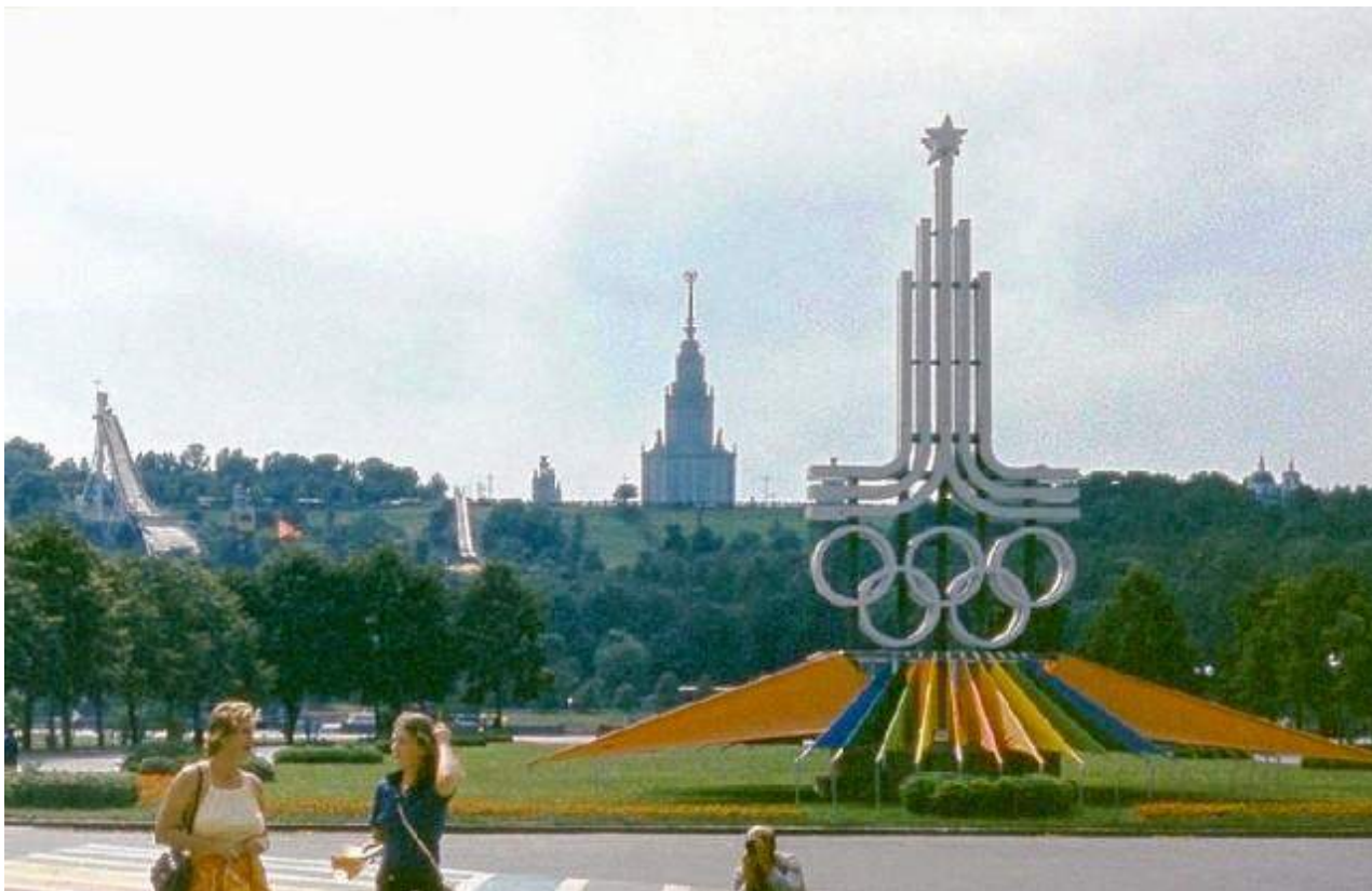
Москва-олимпийская, 1980 год.

Остальные советские граждане, не участвовавшие в этом празднике предспортивной «халявы», спокойно спали, не подозревая, что Москва скоро станет центром мирового внимания. По поводу жарких предолимпийских баталий следует отметить, что приём Олимпиады в послевоенные десятилетия XX века всегда был престижным для страны-организатора. И, если, он и не приносил значительных финансовых прибылей, (все предыдущие Олимпиады были попросту убыточными), то укреплял политический имидж, закономерно поднимая авторитет страны в мире.