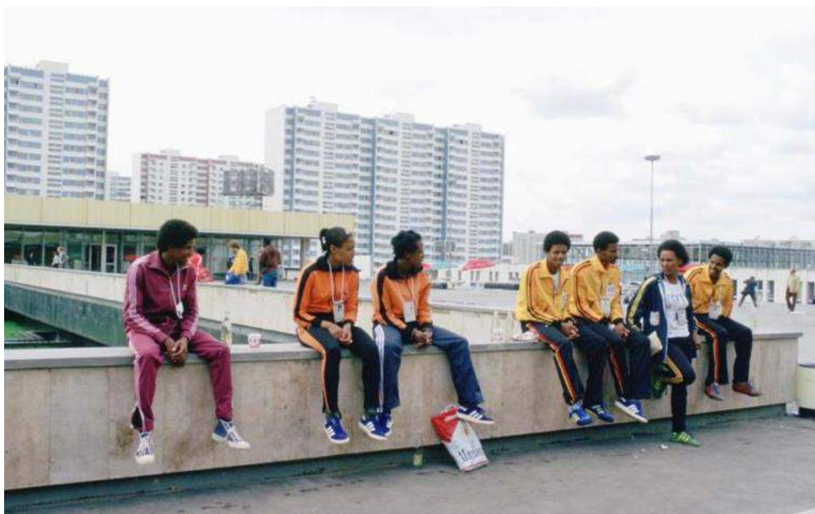
Олимпийская деревня. Москва 1980 год.

Говорят, что во время сочинской Олимпиады 2014 года на обслуживание гостей привлекали слушателей Военного Университета МО РФ, бывшего ВИМО. Очень хочется надеяться, что они, все-таки, работали более продуктивно и получили хорошую языковую практику во время нормального человеческого общения.