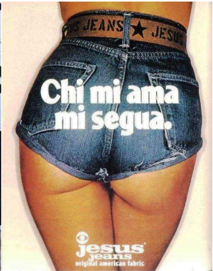
Популярные в Европе итальянские джинсы Jesus приехали в Москву слишком рано.