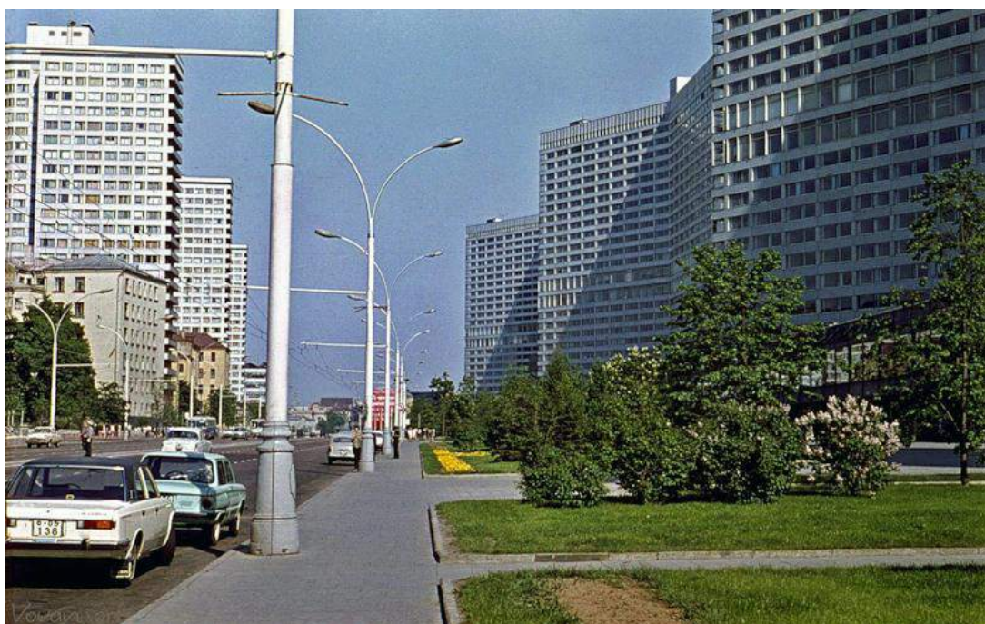
Москва-олимпийская, 1980-й год