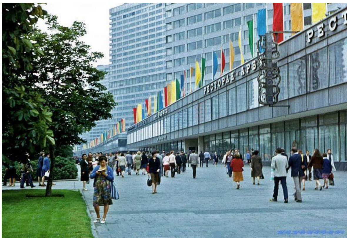
Москва-олимпийская, 1980-й год.

Согласно секретному распоряжению 1979 года «О введении временных ограничений на въезд в г. Москву в период Олимпиады-80», высылке за 101-й километр подлежали неблагонадёжные (диссиденты) и антисоциальные элементы: люди без определённого места жительства, уличные попрошайки, наркоманы и алкоголики, фарцовщики и проститутки. Любопытный факт: принято считать, что в СССР не было организованной преступности, однако в июле 1980 года министр внутренних дел РСФСР Николай Щёлоков провёл неофициальную встречу с главарями советских банд, запретив им какую-либо деятельность в период Олимпиады. Бандиты были разоружены (операция «Арсенал»): сотрудники КГБ изъяли более тонны взрывчатых веществ, почти тысячу пистолетов, полторы тысячи винтовок, сто сорок шесть автоматов и 25 пулемётов. ...Основные усилия органов МВД и КГБ направляются на предотвращение возможных террористических и иных особо опасных уголовных преступлений. Одновременно осуществляются мероприятия по обеспечению безопасности членов Олимпийской семьи, корреспондентов, судейского персонала, конгрессменов, официальных лиц, туристов и других иностранцев, прибывающих на Олимпийские игры. В этих целях разработана следующая система мер: