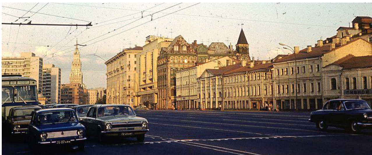
Москва олимпийская, 1980 год.