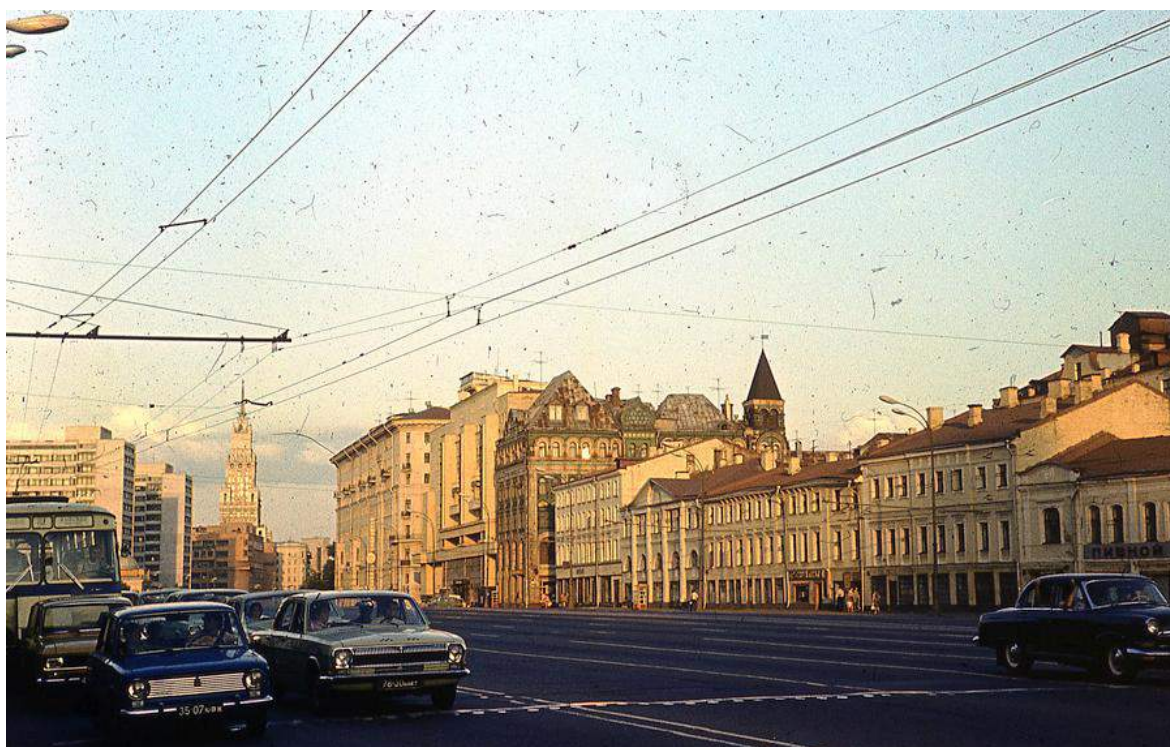
Москва-олимпийская, 1980 год

«...За последнее время с президентом Международного Олимпийского Комитета (МОК) лордом Килланиным (так в тексте.- „Власть“) проводились консультации и переговоры по кандидатуре Москвы на организацию Олимпийских игр 1980 года... При содействии Национального Олимпийского комитета Румынии такая встреча была проведена в г. Бухаресте 22 июня с. г... Беседа подтвердила позитивное отношение президента МОК к кандидатуре Москвы. Президент МОК Килланин обратил внимание на необходимость усиления советскими организациями дальнейшей пропагандистской работы в пользу кандидатуры Москвы. Он также указал на трудности, связанные с возможностью создания блоков среди членов МОК при проведении тайного голосования на предстоящей сессии МОК в Вене в сентябре с. г. По мнению Килланина, такой блок против Москвы может быть создан членами МОК от большинства стран Латинской Америки, некоторых азиатских стран, которые отличаются своими консервативными, а порой и прямо антикоммунистическими взглядами».