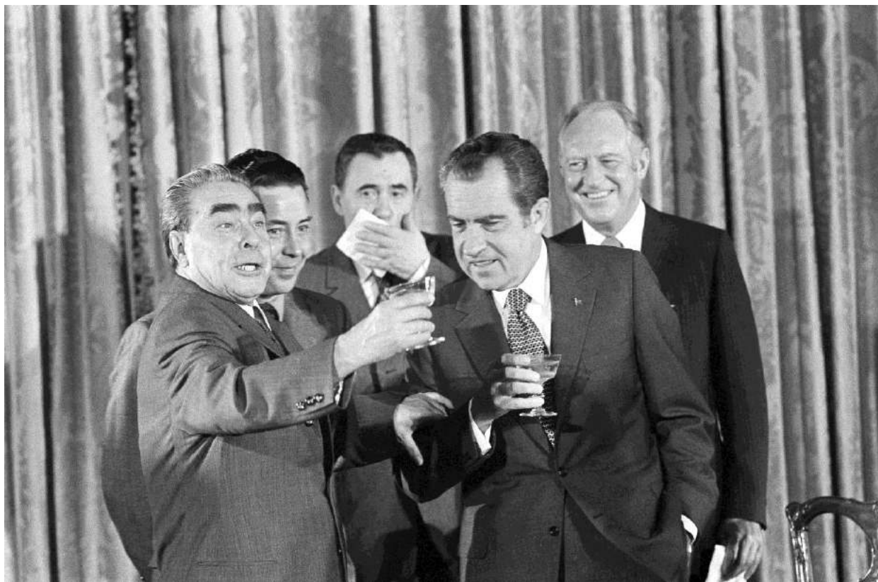
Мировые лидеры, 1980-е годы.