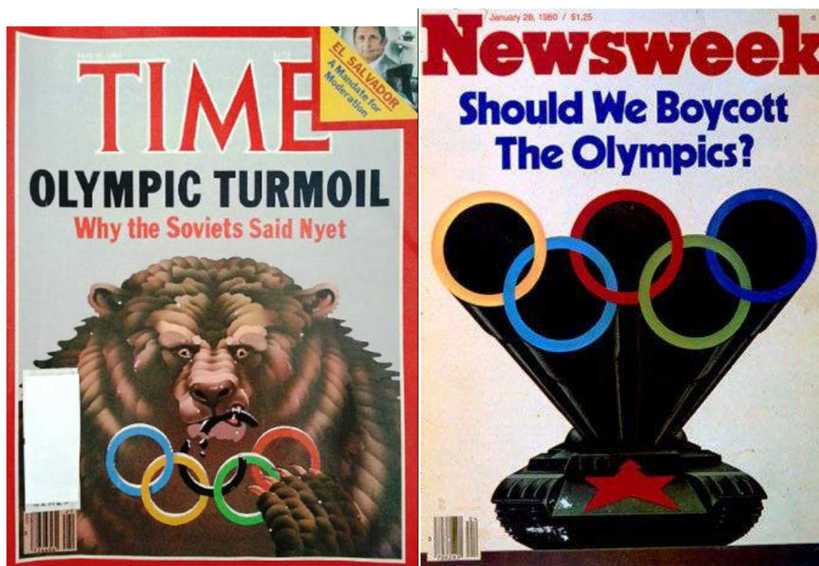
Бойкот Олимпиады - всегда сенсация в западной прессе. 1980-е годы.

товарам, и урвать это счастье надо вовремя. А нас, счастливых курсантов «не-олимпийцев» ожидало занимательное шоу под названием «Москва освобожденная».