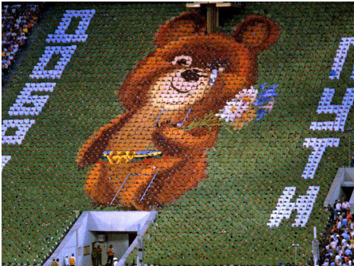
Церемония закрытия, Москва 1980 год.

Надеюсь, что мои читатели, кто по воле судьбы видел или работал на Олимпиаде-80 вспомнят это славное мероприятие и себя в эпоху развитого социализма.