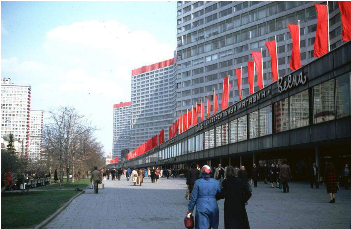
Москва-олимпийская, 1980 год.