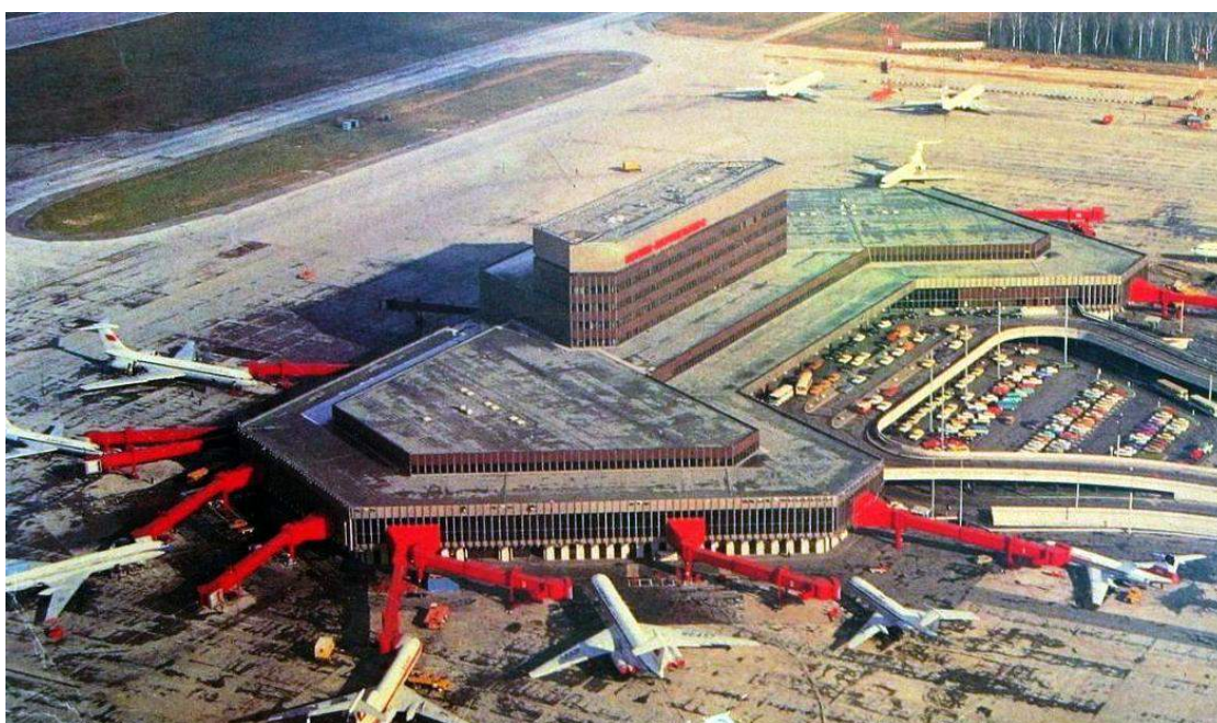
Шереметьево-2. 1980 год.