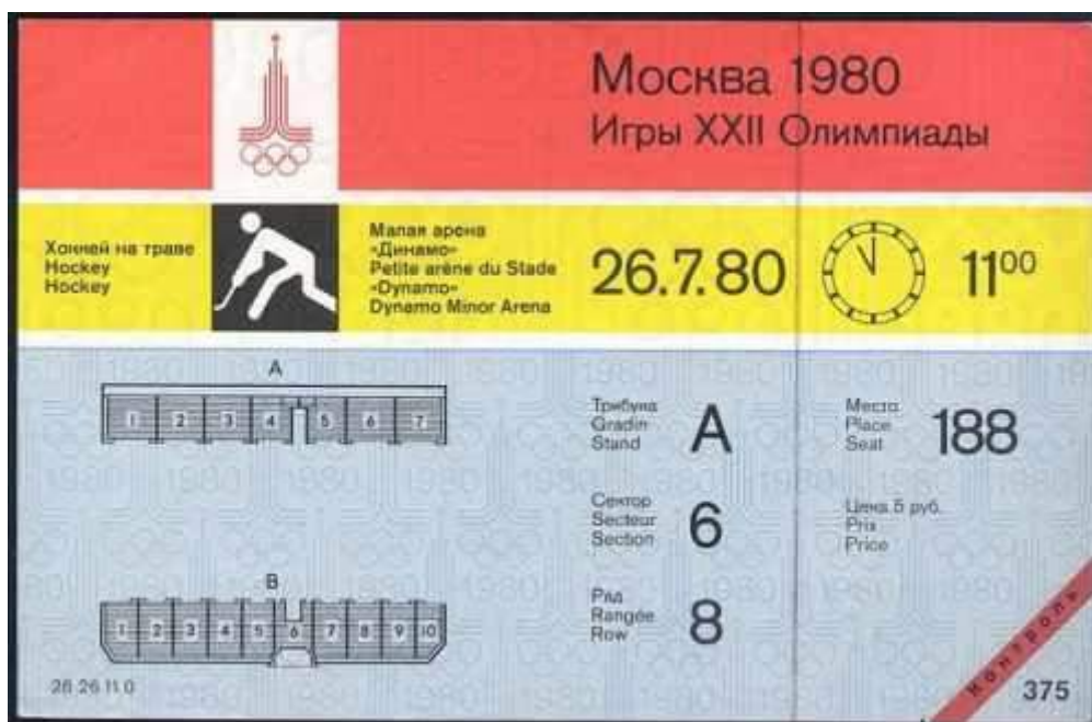
Олимпийский билет на хоккей на траве, Москва 1980 год.

Словом, провал был страшный. Отчаянная попытка изобразить радостный праздник на самих стадионах полностью провалилась. Москвичи тихо роптали по поводу затрат на билеты и идиотские поездки на стадион, и лишь незначительная часть свободных зевак радовалась празднику. Я сам побывал на трех олимпийских мероприятиях и могу с честью сказать, что Олимпийские игры 1980 года я видел. Олимпийские билеты стоимостью 30 копеек, (вместо 3 руб), не нанесли большого ущерба семейному бюджету. Старая цена