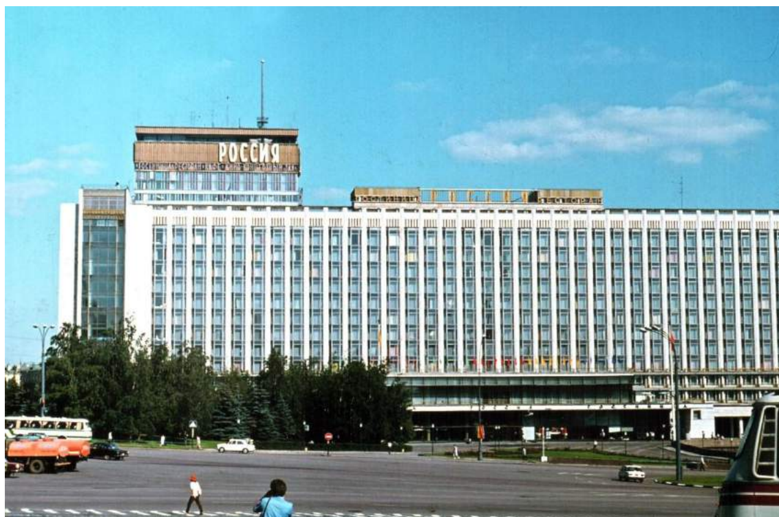
Москва-олимпийская, 1980 год.