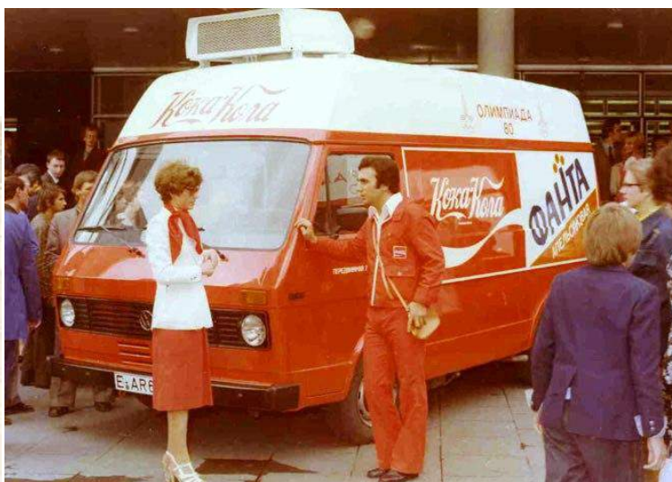
Новые товары в Москве-80.