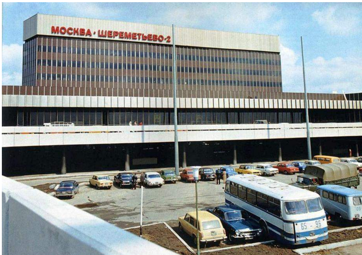
Шереметьево-2. 1980-й год.